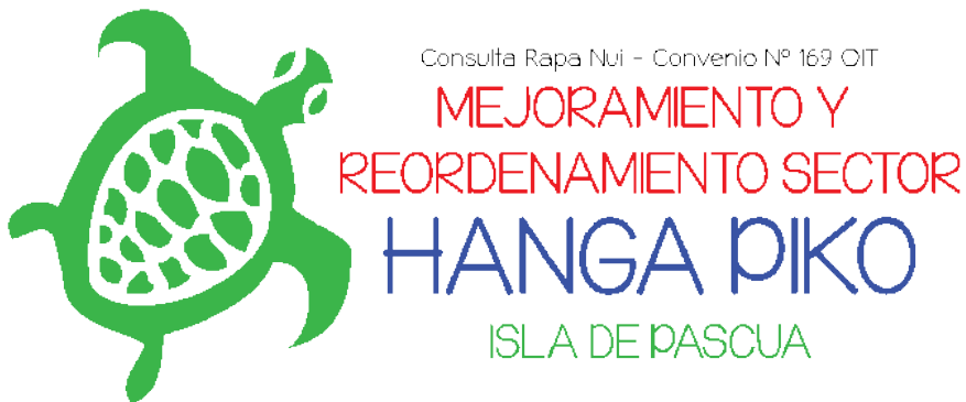
Figura N°2 Imagen Consulta Hanga Piko

Asimismo, según la investigación conceptual realizada es un animal que se considera noble, por ser también un alimento, y que puesto en joyas o accesorios representa también el amor.