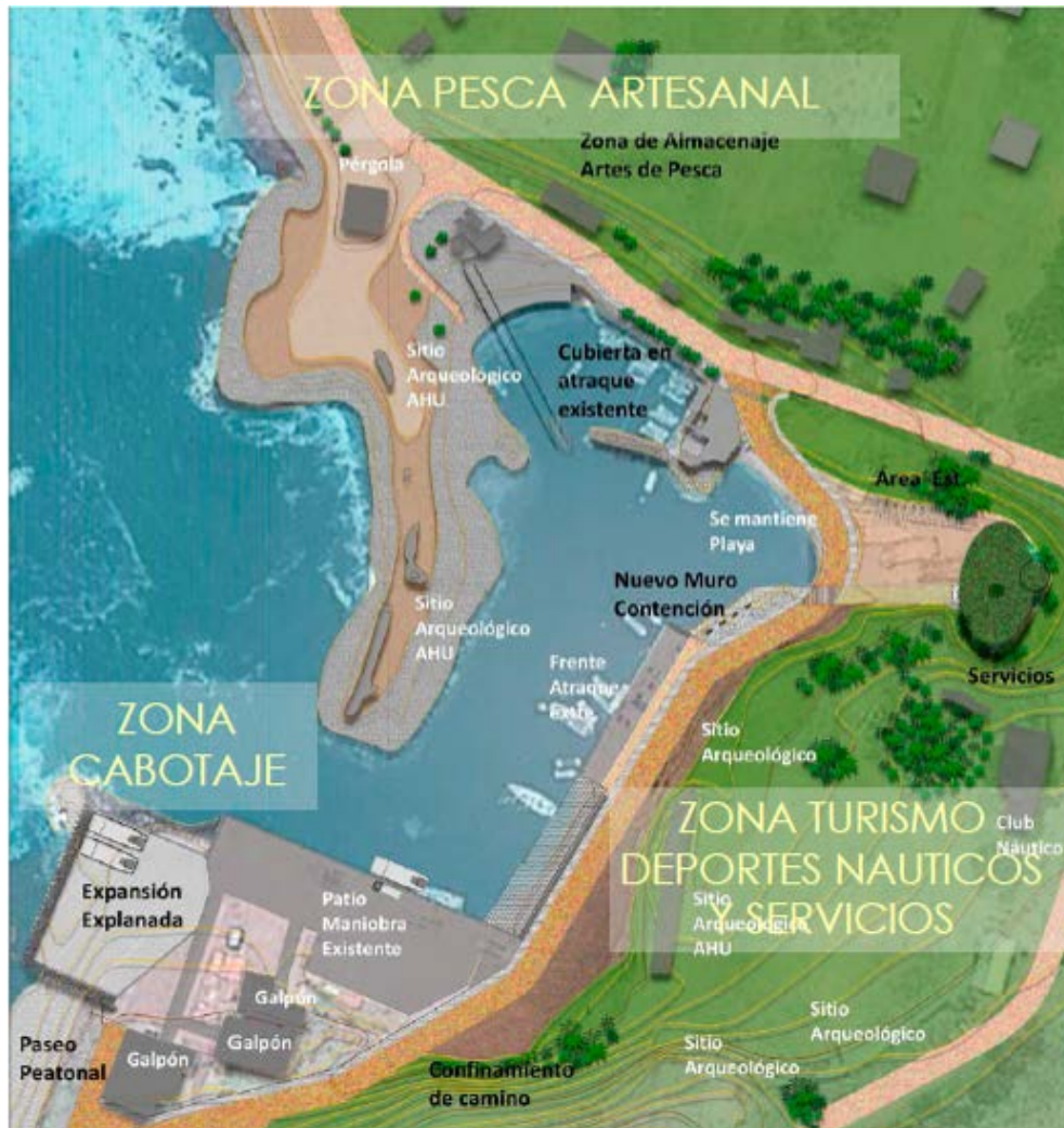
Figura N°1 Propuesta Conceptual Zonificación