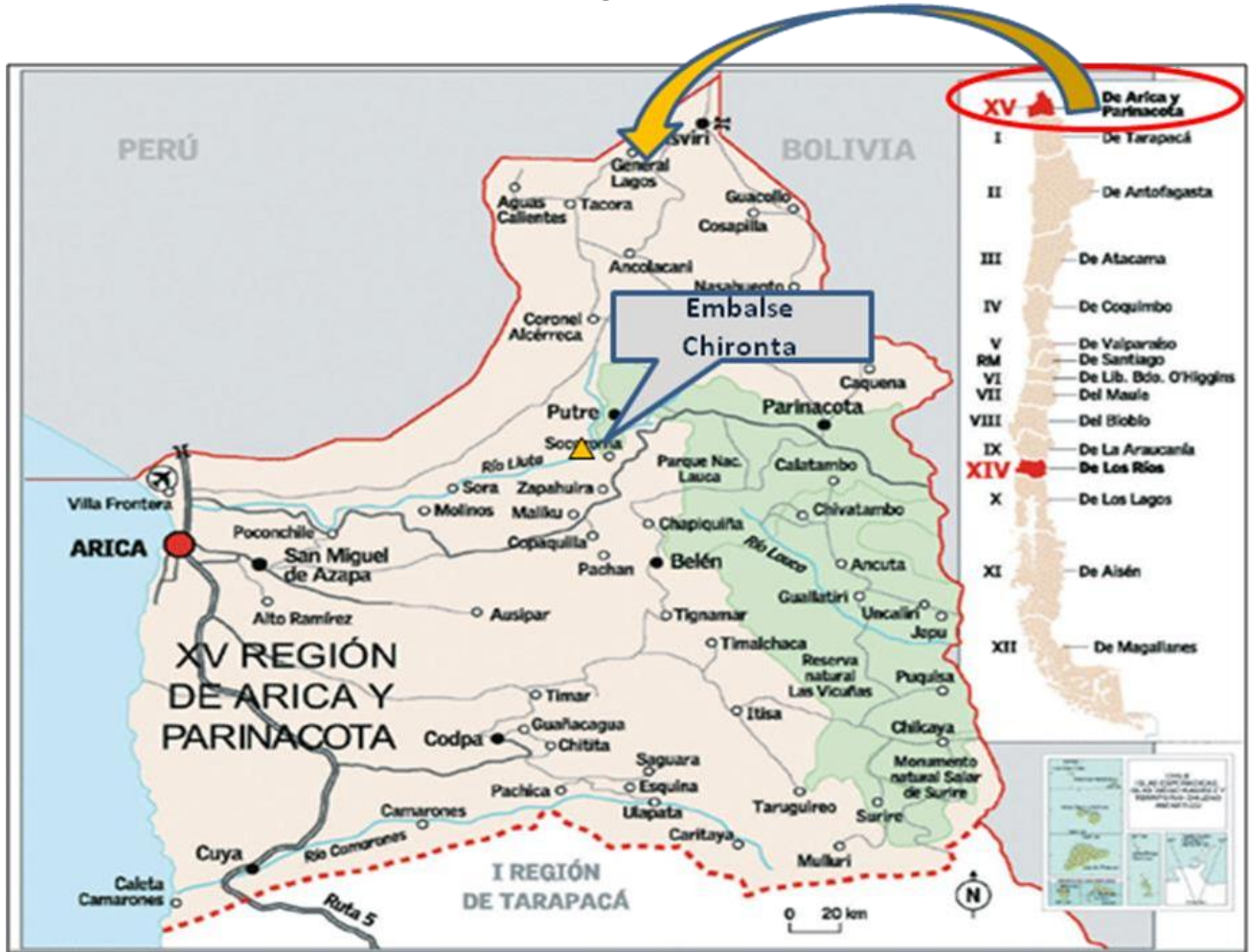
Figura 3-1. Plano de Ubicación General Emplazamiento Proyecto “Embalse Chironta” a Nivel Regional

El embalse se ubicará en el río Lluta, en el sector denominado Angostura de Chironta, aproximadamente a 70 km de la desembocadura del río Lluta hacia aguas arriba, como muestra la siguiente figura: