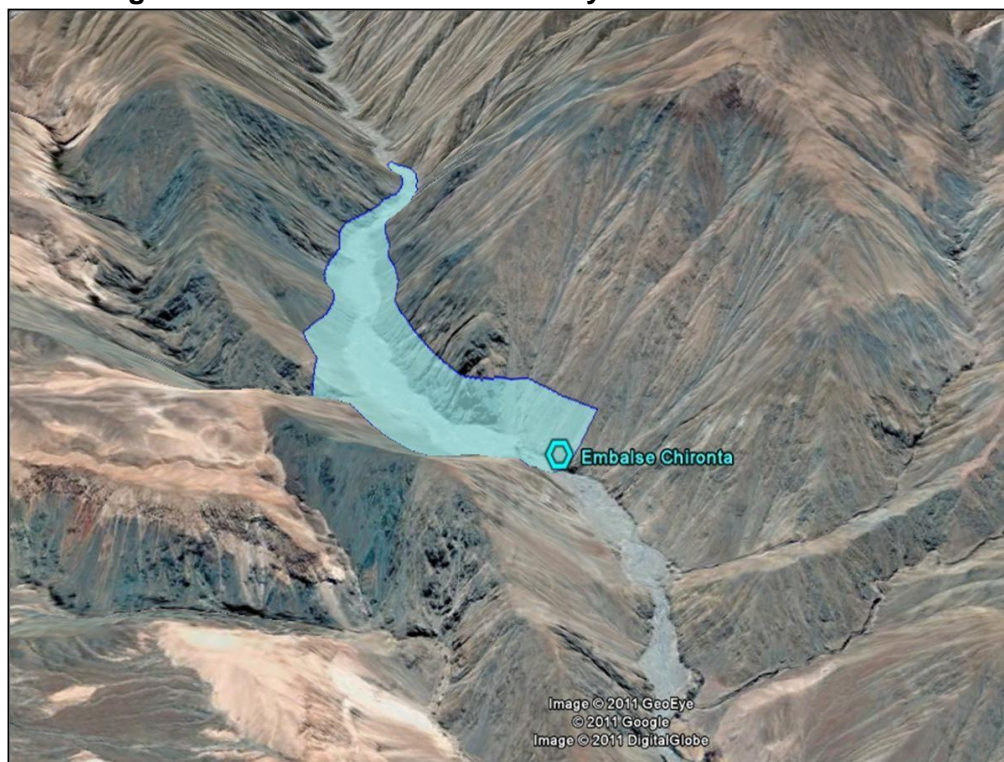
Figura 3-3. Área de Inundación Proyecto Embalse Chironta

El embalse tendrá una superficie inundada de 57 ha, con una longitud de 1,9 km, según se aprecia en la figura siguiente: