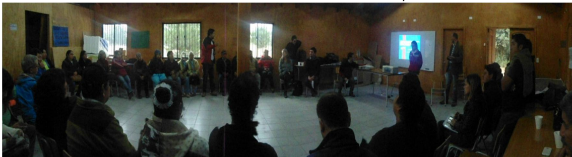
Figura Nº 4 Reunión en la sede comunitaria de Quelhue, Pucón.