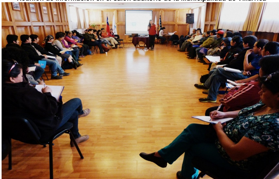
Figura Nº 3 Reunión de información en el salón auditorio de la Municipalidad de Villarrica