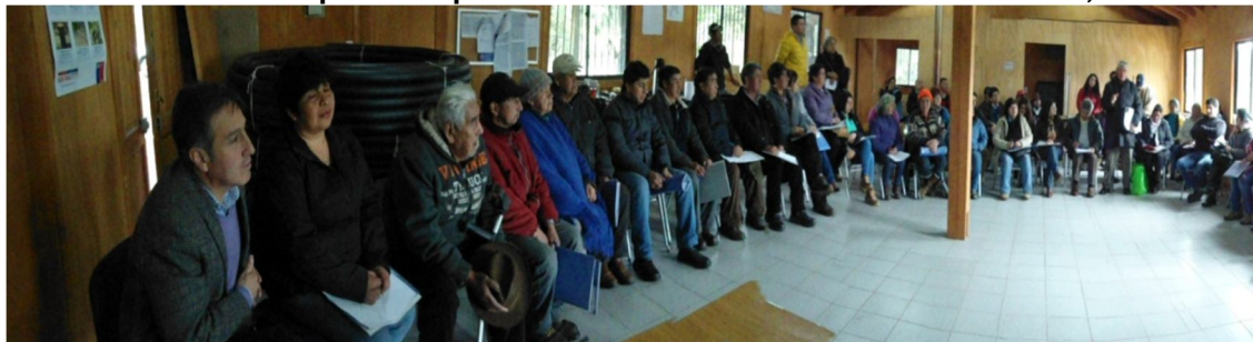
Figura Nº 2 Reunión de la etapa de Preparación en el salón comunitario de Quelhue, Pucón