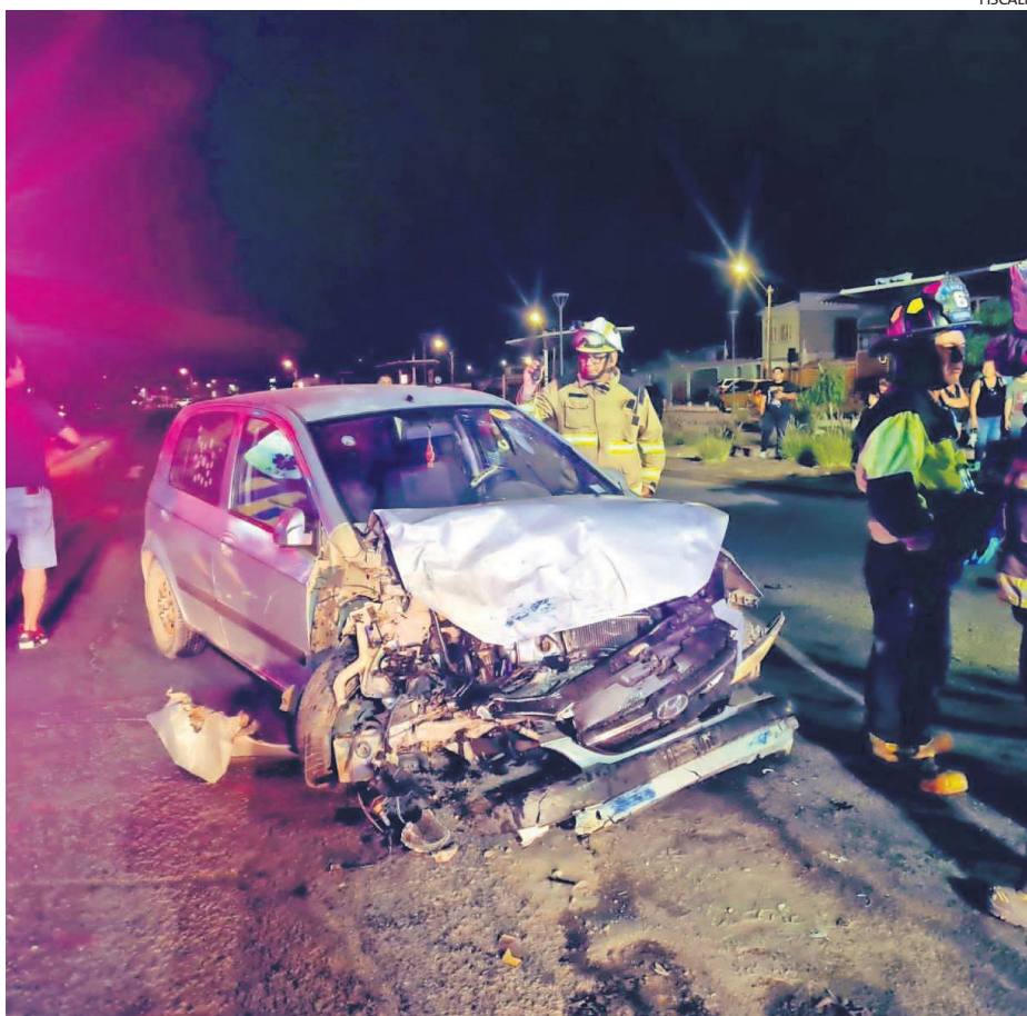
CUERPO DE BOMBEROS DE ARICA CONCURRIÓ HASTA EL LUGAR

MEDIDAS CAUTELARES Durante la jornada de ayer, ambos imputados pasaron a control de de-