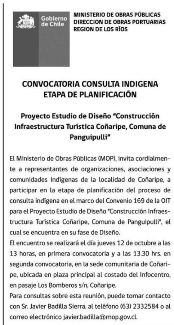
Figura 1-4 Aviso en diario Austral de Valdivia

Además, se publicó un aviso en la Radio Picarona de circulación comunal.