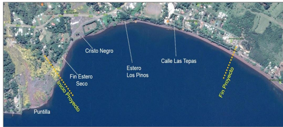
Figura 1-2: Ubicación sector de estudio